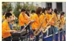
うつのみやジュニアジャズオーケストラ