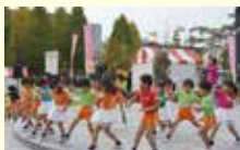
(福)聖会バンピーニとよさとの園児