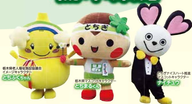
栃木県老人福祉施設協議会 イメージキャラクター とちぶくちゃん